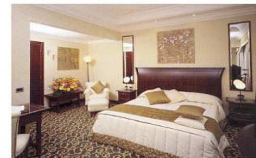
The hall and the rooms.