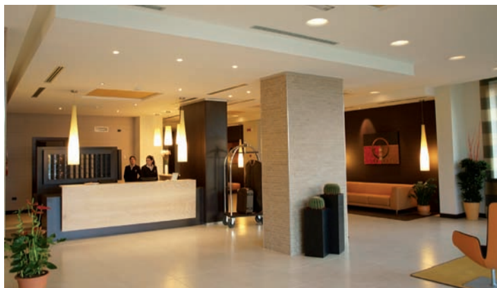
IL RISTORANTE E LA HALL